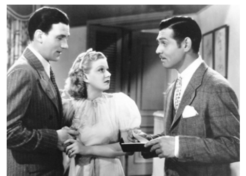
1937 SARATOGA (Saratoga) de Jack Conway avec Walter Pidgeon, Clark Gable