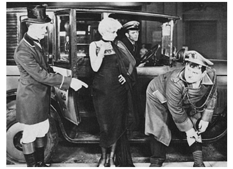
1928 SON ALTESSE ROYALE (Double Whoopee) de Lewis R. Foster avec Stan Laurel, Oliver Hardy