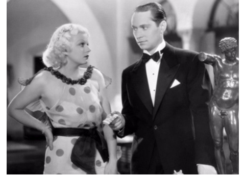
1934 LA BELLE DU MISSOURI (The Girl from Missouri) de Jack Conway avec Franchot Tone