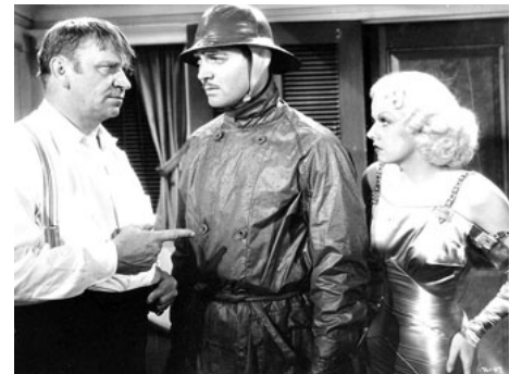
1935 LA MALLE DE SINGAPOUR (China Seas) de Tay Garnett avec Wallace Beery, Clark Gable