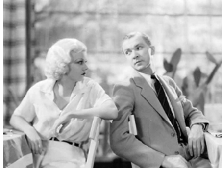
1933 MADEMOISELLE VOLCAN (Bombshell) de Victor Fleming avec Lee Tracy