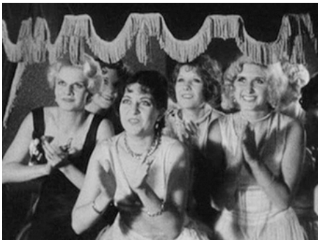
1929 PARADE D'AMOUR (The Love Parade) d'Ernst Lubitsch avec Jean Arthur