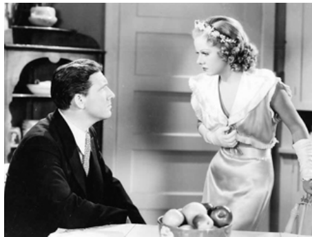
1935 LA LOI DU PLUS FORT (Riffraff) de J. Walter Ruben avec Spencer Tracy