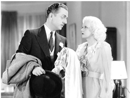
1935 IMPRUDENTE JEUNESSE (Reckless) de Victor Fleming avec William Powell