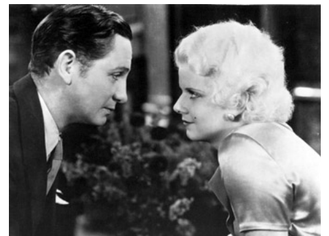
1931 BLONDE PLATINE (Platinum Blonde) de Frank Capra avec Robert Williams