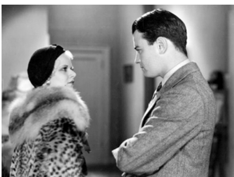
1931 L'HOMME DE FER (Iron Man) de Tod Browning avec Lew Ayres