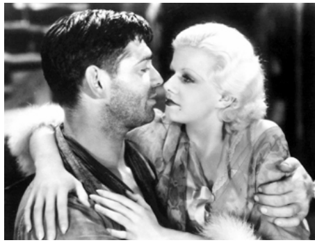
1932 LA BELLE DE SAÏGON (Red Dust) de Victor Fleming avec Clark Gable