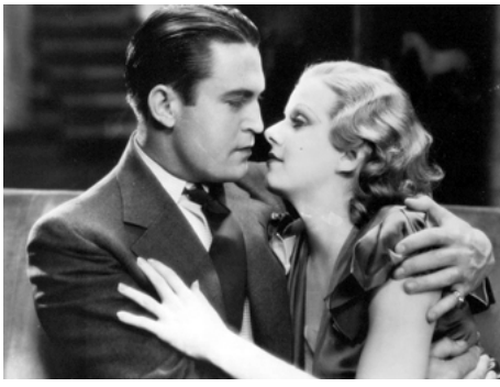
1932 LA FEMME AUX CHEVEUX ROUGES (Red-headed Woman) de Jack Conway avec Chester Morris