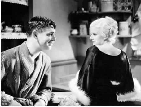
1933 DANS TES BRAS (Hold your man) de Sam Wood avec Clark Gable