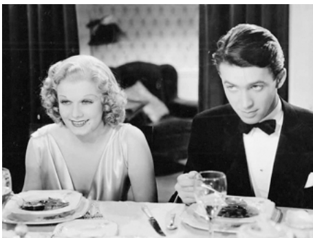
1935 SA FEMME ET SA DACTYLO (Wife vs Secretary) de Clarence Brown avec James Stewart