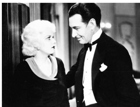
1931 THREE WISE GIRLS de William Beaudine avec Walter Byron