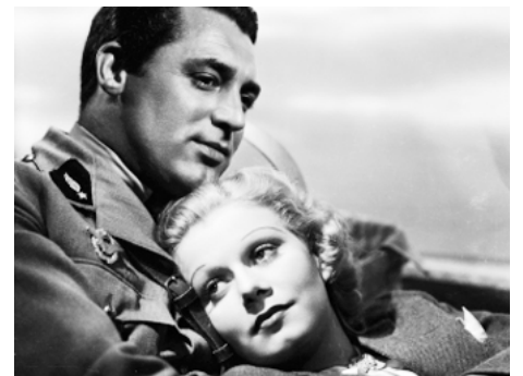
1936 UNE BELLE BLONDE (Suzy) de George Fitzmaurice avec Cary Grant