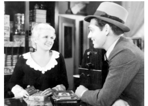
1930 TRIBUNAL SECRET (The Secret Six) de George Hill avec Clark Gable