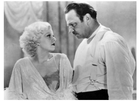
1932 LES INVITÉS DE HUIT HEURES (Dinner at eight) de George Cukor avec Wallace Beery