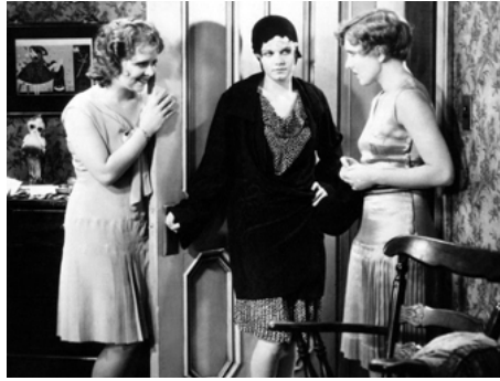
1929 LA CADETTE (The Saturday Night Kid) d'A. Edward Sutherland avec Clara Bow, Jean Arthur