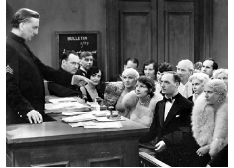
1929 LES NUITS DE NEW YORK (New York Nights) de Lewis Milestone avec Norma Talmadge