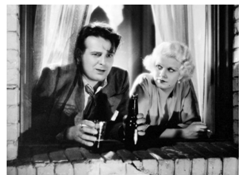
1931 LA BÊTE DE LA CITÉ (The Beast of the City) de Charles Brabin avec Wallace Ford