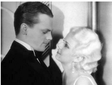
1930 L'ENNEMI PUBLIC (The Public Enemy) de William A. Wellman avec James Cagney