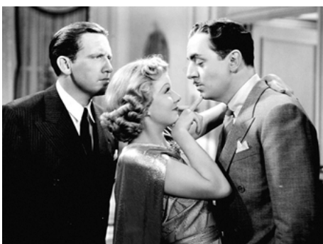
1936 UNE FINE MOUCHE (Libeled Lady) de Jack Conway avec Spencer Tracy, William Powell